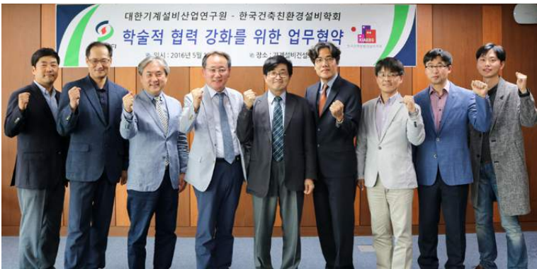
협약식 후 기념촬영