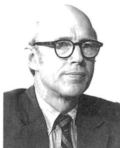
윌리엄 글라이스틴 전 주한 미국대사 (1926~2002)

상대가 대사인 점을 고려하여 “제외될 수도 있다.”고 통역을 했다. 그런데 김 사장이 영어를 잘 모른다고 생각한 필자가 외교적 수사로 통역한 것은 큰 실수였다. 김 사장은 필자의 통역이 명확하지 않다고 지적하면서 “반드시 제외될 것이다.”라고 수정하라고 지시했다. 이를 대사에게 그대로 전달하자 그는 매우 놀라면서 미국 정부는 이미 한미 원자력협정의 개정을 의회에 요청 중에 있고 시간이 다소 지연될 수 있음을 양해해 달라고 요청했다.