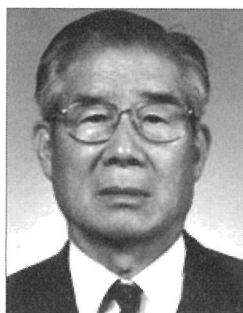
김영준 전 한전 사장 (1916~2004)