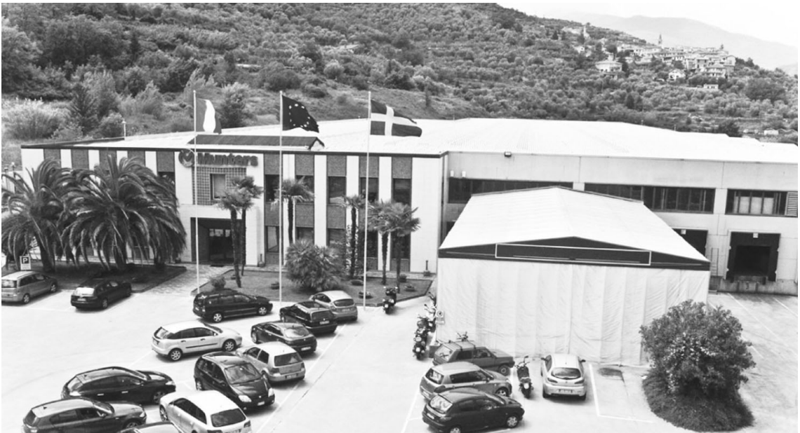
▲ 문터스 이터리 공장 전경