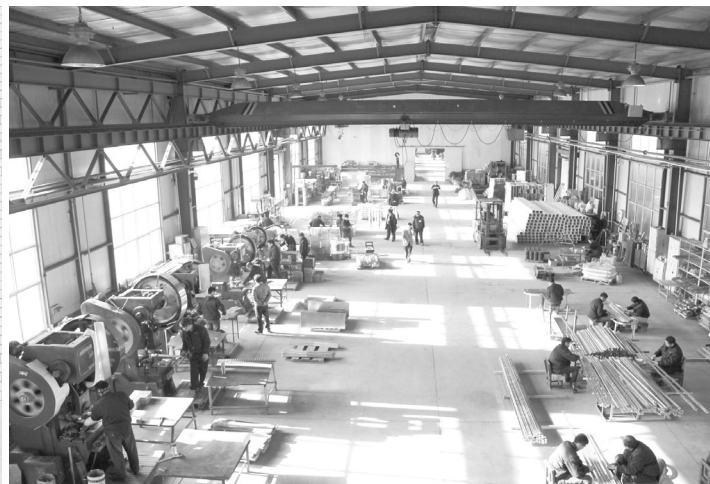
▲ 천진보일사양설비유한공사 공장 내·외부 광경