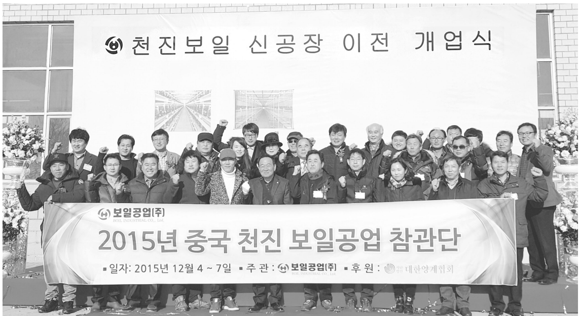
▲ 천진보일사양설비유한공사 신공장 이전 및 개업식을 축하하기 위해 참석한 참관단이 보일공업(주)의 발전을 기원하며 화이팅을 외치고 있다.