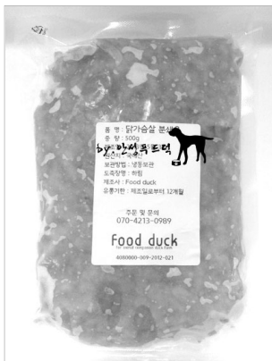
▲ 한국 닭가슴살 분쇄육 (개당 8,000원/1kg)

있는 실정이다. 이외에도 종계의 부산물(닭벼슬, 뼈 등)을 통한 고부가가치원료로 상용화하는 노력을 기울여 종계성계육의 가치를 높이는 일련의 노력이 필요할 것으로 보여진다. 양계