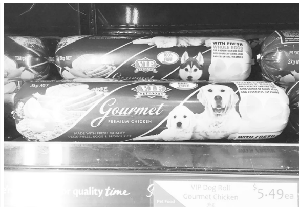
▲ 호주 Baiada사에서 만든 애완견 닭고기 간식(개당 4,880원/3kg)

〈그림1〉 한국 · 호주에서 생산 · 판매하는 성계육을 활용한 애완용 닭고기 간식