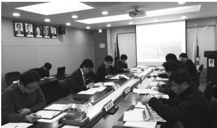
(주)리버앤틱 방재신기술 보호기간연장 평가위원회

(주)리버앤틱의 방재신기술 지정29호는 국민안전처(장관 박인용)로부터 4년간의 보호기간 설정과 함께 신기술 지정서를 재교부 받을 예정이다.