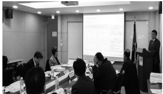
15.12.21(월)_ (주)효성엘비테크 외 1개사