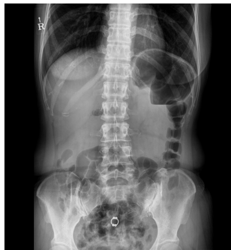
Fig. 1. The image of the abdominal X-ray.