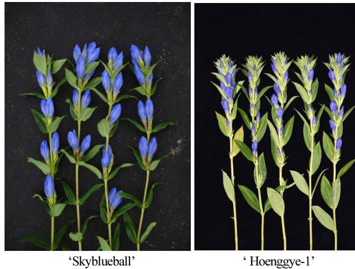
Fig. 2. The flower shape of a new Gentiana spp. cultivar, ‘Skyblueball’ and ‘Hoenggye-1’.