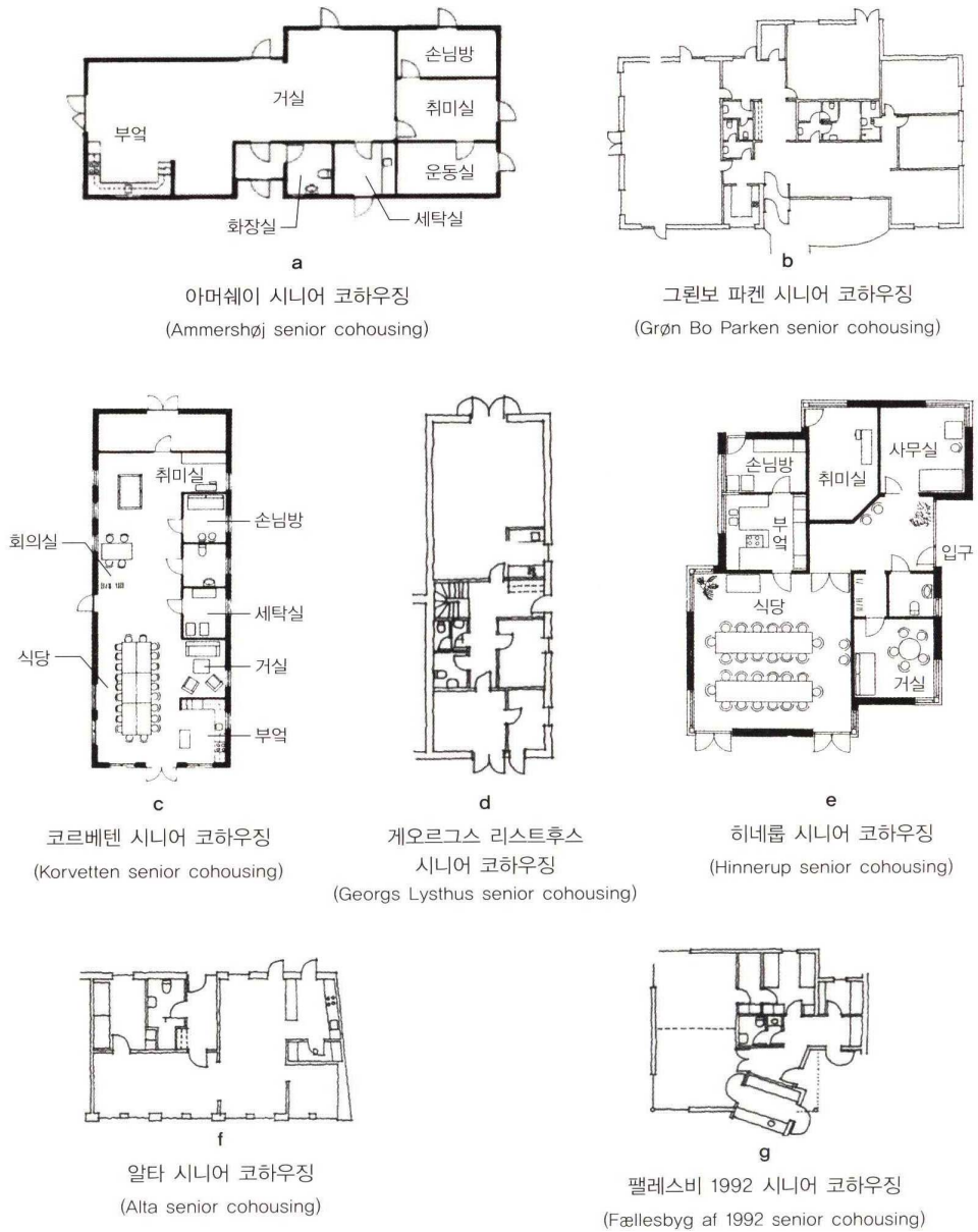
Figure 1. Common House of Senior Cohousing