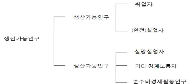
<그림 1>. 노동력 상태의 구분

‘경력단절자(또는 실업자)’는 임금 또는 비임금근로자가 아니고 기준기간동안에 일하는 것이 가능하며 일을 하기위한 적극적인 구직활동을 한 사람으로 정의되며 ‘비경제활동인구’란 특정연령(15세)이상의 사람 중 취업자도 실업자도 아닌 사람으로 정의한다(이정숙, 2015). 특히 경력단절여성은 경제노동자로 구분되는데 이러한 경제실업개념은 숨겨진 실업자로서의 여성 즉 근로의지가 있어도 당장 취업하지 못할 상황에 처한 여성들의 직업단절 양상을 가시화하는데 도움이 된다.