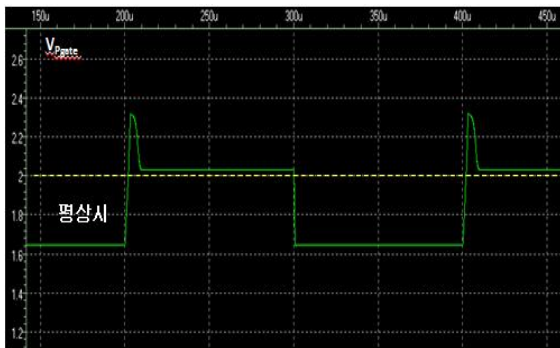
Fig. 2. MOSFET simulation results 그림 2. MOSFET 시뮬레이션 결과

그림 2는 NMOS의 시뮬레이션 결과로 정상시에는 MOSFET을 Linear 영역에서 동작시켜 전