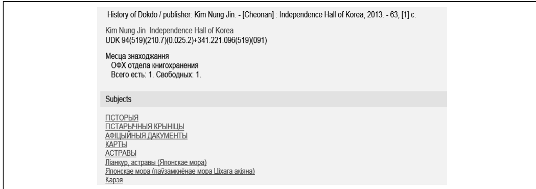
〈그림 3〉 벨라루스 국가도서관의 목록레코드 예시