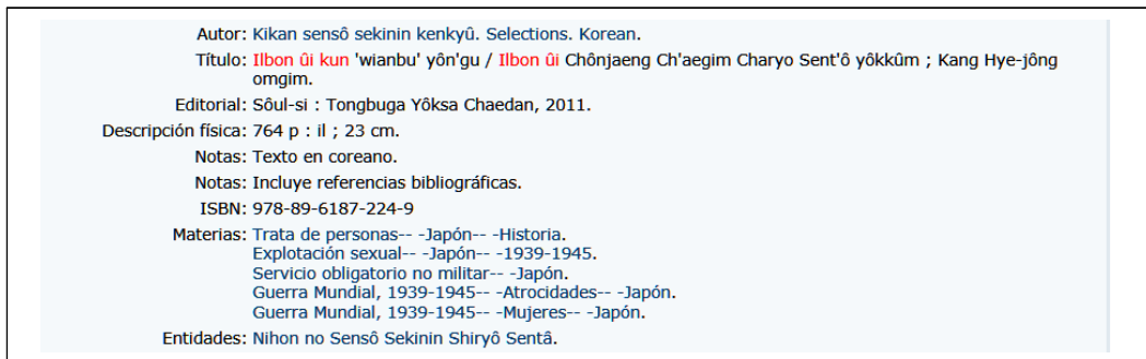
<그림 6> 페루 국가도서관의 목록레코드 예시

‘태권도’관련 레코드는 7건이며, 주제명은 모두 ‘Taekwon-Do’로 부여되어 있다. 가라테(Karate)는 28건이 검색되며, 태권도와 가라테를 구분하여 주제명을 부여하고 있다. ‘김치’관련 레코드는 1건이 검색되며, 주제명은 ‘Kimchi’로 나타나 있다. ‘독도’관련 레코드는 ‘Dokdo’라는 키워드로 2건이 검색되며, 주제명은 ‘Tok, Isla (Corea)’와 같이 표기되어 있다. ‘동해’관련 레코드는 키워드 ‘East Sea’로 1건이 검색되며, 주제명은 ‘Japón, Mar de’로 표기되어 있다. ‘압록강’관련 레코드는 키워드 ‘Yalu’로 1건이 검색되며, 주제명은 나타나 있지 않다. 백두산과 두만강 관련 레코드는 검색되지 않는다.