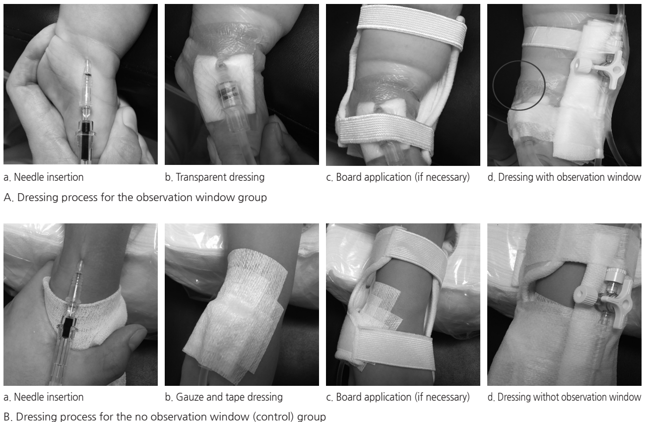
Figure 1. Dressing process for the observation window group and control group.

본 연구 도구는 연구 대상자의 일반적 특성, 말초정맥관 삽입 관련 특성과 침윤단계로 구성된 조사기록지이다. 이 중 일반적 특성, 말초정맥관 삽입 관련 특성은 대조군과 관찰창군에서 침윤발생위험요인이 동질하게 분포하는 지를 파악하기 위해 조사한 것으로, 입원 환자의 침윤위험요인을 조사한 Park [23]의 연구에서 침윤발생 위험요인으로 확인된 변수를 중심으로 선정하였다. 구체적으로 일반적 특성은 성별, 연령, 진료과이며, 말초정맥관 삽입 관련 특성은 말초정맥관 삽입일시, 제거일시, 보유기간, 삽입 부위와 주입약물(10% 포도당, 암피실린/설박탐, 반코마이신, 고농도전해질, 페니토인, 스테로이드 등)이었다. 고농도전해질은 칼슘(calcium geyconate), 소듐바이카보네이트(sodium bicarbonate), 포타슘(potassium chloride), 마그네슘(magnesium sulfate)을 포함하였고, 스테로이드류는 덱사메타손(dexamethasone), 하이드로코티손(hydrocortisone), 메틸프로드리솔론(methylprednisolon)을 포함하였다. 침윤단계는 Flemmer 과 Chan [22]의 침윤단계 체계를 기본으로 하되 부종의 크기는 Infusion Nurses Society [24]의 침윤도구에서 제시하는 크기를 적용