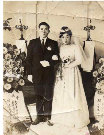
<Fig. 8> Wedding ceremony in 1962, Jeju

양복을 착용하고, 신부는 라운드 넥라인과 타이트 소매의 흰색 웨딩드레스를 착용하고 짧은 베일과 아스파라거스 소재를 사용한 부케를 들고 있다.