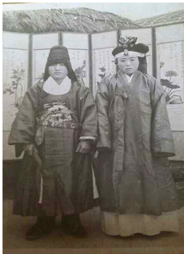
<Fig. 3> Wedding ceremony in 1962, Jeju