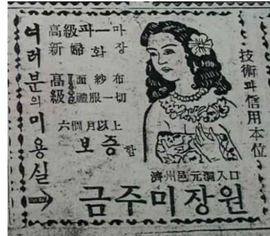
<Fig. 11> Kumju beautyshop's promotion (Jejuilbo, 1953, n.d.)

식 예복과 면사포를 대여하였음을 알 수 있다. 제주 지역에서 양복과 웨딩드레스가 본격적으로 확대된 시기는 1960-1964년대이며, 대중적으로 착용된 시기는 1970-1974년대라고 할 수 있다. 이후 급격히 증가하여 1975-1979년대에 절정에 돌입하여 현재까지 대중적인 혼례복 유형으로 정착되고 있다.