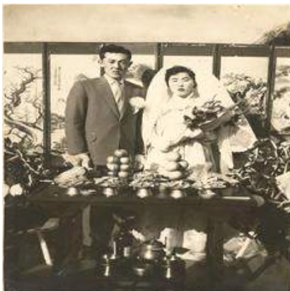
<Fig. 1> Wedding ceremony in 1960, Jeju

제주의 혼례에는 유교적인 특성과 무속신앙이 혼재된 양상으로 표현되고 있는 경우가 있으며, 이러한