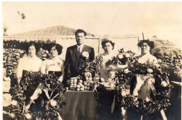
<Fig. 2> Wedding ceremony in 1957, Jeju