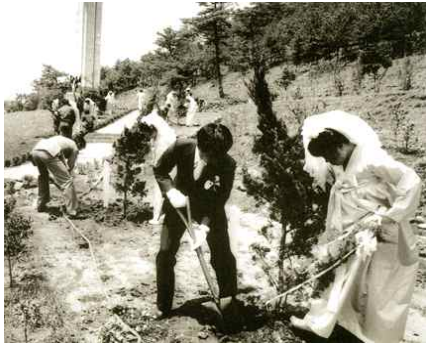
<Fig. 10> wedding anniversary trees in Mochungsa in 1979 (jejudomin.co.kr, 2013, n.d.)