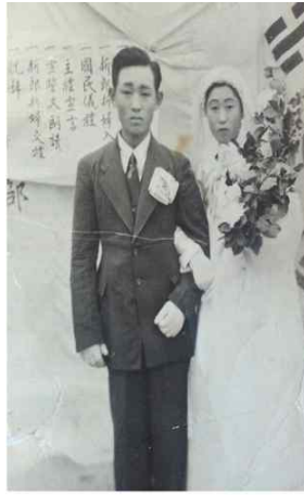
<Fig. 7> Wedding ceremony in 1960, Jeju