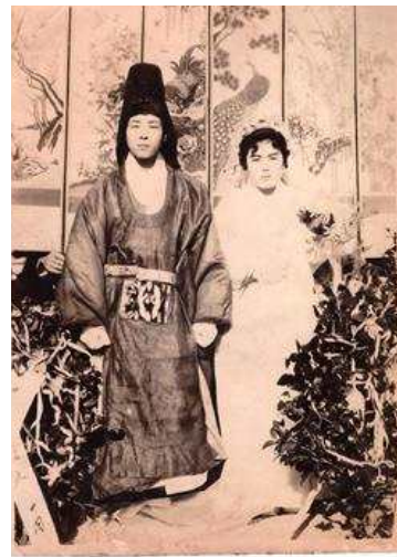
<Fig. 5> Wedding ceremony in 1962, Jeju