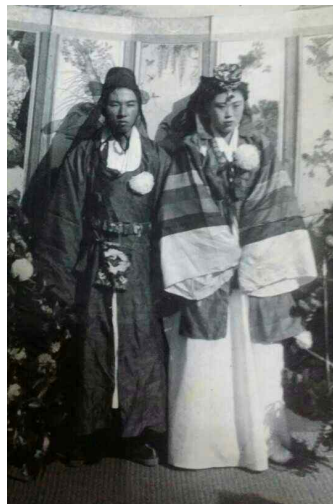
<Fig. 4> Wedding ceremony in 1952, Jeju