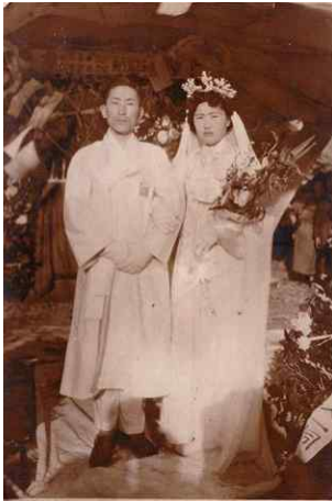
<Fig. 6> Wedding ceremony in 1955, Jeju