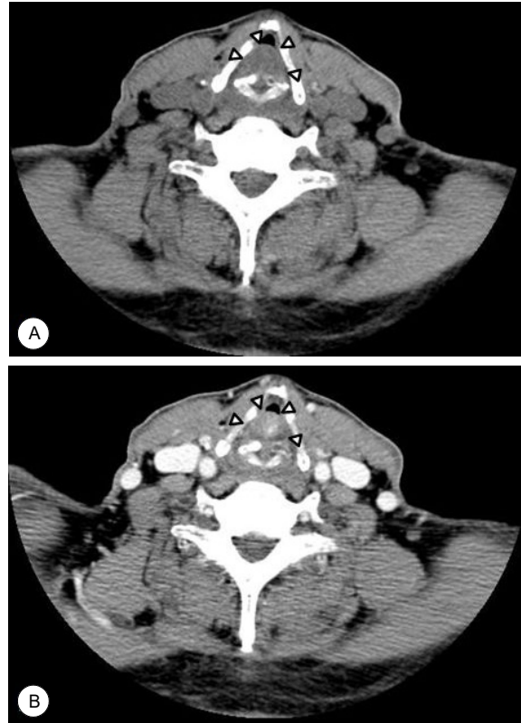
Fig. 2. Neck computed tomography (CT) scans. Preoperative non-enhanced axial CT shows 1.3 × 1.1 cm sized soft tissue density mass in posterior glottis area (arrowhead)(A). Preoperative enhanced axial CT shows 1.3 × 1.1 cm sized homogeneously enhanced soft tissue mass in posterior glottic area (arrowhead)(B).

경부컴퓨터단층촬영에서 비교적 경계가 명확하며, 성문부를 채우고 있는 약 1.3 × 1.1 cm 크기의 균일한 조영증강을 보이는 종물이 관찰되었으나, 주변 림프절증대의 소견은 관찰되지 않았다(Fig. 2A and B). 술 전 음성검