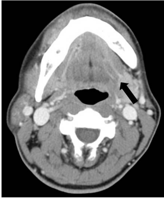
Fig. 1. Enhanced CT image shows dilatation of Wharton's duct (black arrow). CT, Computed Tomography