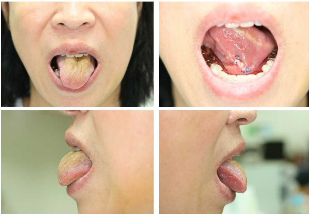
Fig. 3. Postoperative photos show the deviation of tongue to right side.

수술 후 2일째 좌측 악하선 부위 통증을 동반한 부종 심해져 타액관 협착 추정하에 경부 전산화 단층촬영 재시행하였고 조영 후 영상에서 악하선관(Wharton's duct)의 이전 타석 위치 근위부에서의 확장이 관찰되어(Fig. 1) 경구강 악하선 절제술을 추가로 시행하였다. 수술 도중 동측 설신경 및 설하신경의 위치 및 손상이 없음을 확인하였다(Fig. 2). 수술 후 혀의 동측 및 반대측 감각에는 이상소견이 없었으나, 수술부위와 반대편으로 즉, 좌측이 아닌 우측으로의 혀의 편위 및 운동장애를 관찰할 수 있었다(Fig. 3). 수술 자세 및 기구에 의한 신경압박으로