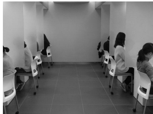
Fig. 1. 온습도 환경이 조절된 감각 평가실과 묘사분석을 수행하고 있는 훈련된 패널

산업체에서 활용하는 감각과학 연구의 두 번째는 기호도 평가이다. 소비자를 특정 장소에 모집하여 컨트롤된 상황에서 제품을 제시하거나 집으로 제품을 보내서 평소