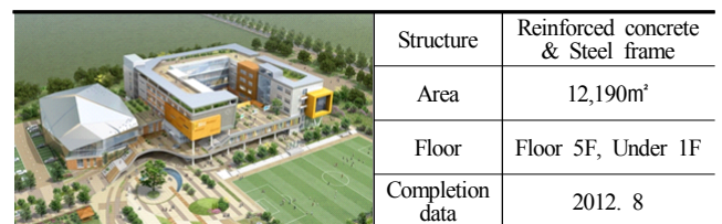
Table 3. Building overview

투입자재의 산업분류에 따른 내재에너지 산출 결과를 다음 Table 4에 나타낸다. 단, 403부문에 대한 모든 결과를 제시하기가 어려운 만큼, 건축재료에 주로 사용되는 몇몇 부문에 대한 결과를 제시하였다.