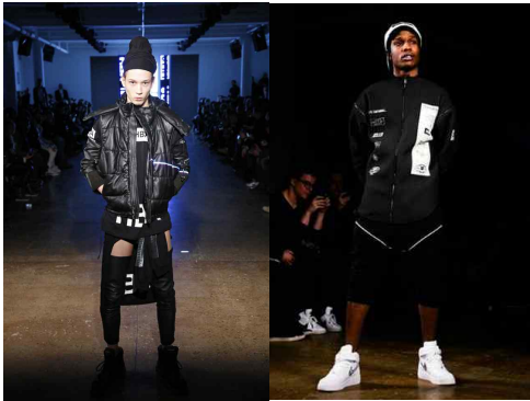
<Fig. 14> HBA 2013 F/W collection : layered goth and ASAP Rocky (left-FRESHNESS, 2013.-a, right-FRESHNESS, 2013.-b)