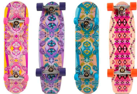
<Fig. 12> Emilio Pucci street and cruiser skateboards (Leen, 2015)

스웨그 룩으로 표현되는 스컬번 힙합에는 스케이트와 힙합적 요소가 문화상호의존적으로 나타난다. 스케이트보드의 테크에 자신만의 개성을 살린 그래피티 작업을 하며, 힙합음악에 맞추어 격렬한 춤과 같은 육체적 움직임을 이용하여 거리의 장애물들을 뛰어넘는 도전을 반복한다. 이 때, 스케이터들은 힙합복식의 형태적 변형으로서, 구체적으로는 1980년대 전반기의 올드 스쿨(Old School)스타일의 변형이자 1980년대 후반기의 뉴 스쿨(New School) 스타일을 차용한다. 몸을 완전히 덮는 오버사이즈의 전통적 힙합 복식보다는 움직임이 용이한 적당한 품과 길이의