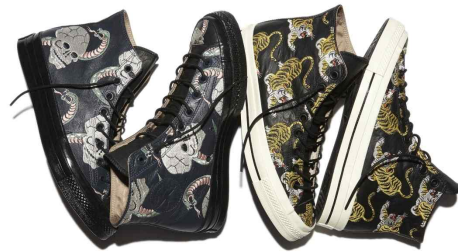
<Fig. 17> Converse Chuck Taylor 1970 Souvenir Jacket collection : Converse and Irazumi style (Yim, 2015)