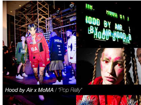
<Fig. 15> HBA × MoMA Collaboration : 'Pop Rally' (Forbes, 2014)

기법은 고스힙합의 어두움과 무게감을 나타내는 데에 효과적으로 활용되었다.<Fig. 14> HBA는 2015 S/S 컬렉션 직후, 2014년 10월 30일, 뉴욕현대미술박물관(MoMA: The Museum of Modern Art)의 팝렐리(Pop Rally) 프로그램에 'ID' 라는 제목의 예술 파티를 주관하기도 하였는데, 이는 뉴욕현대미술관이 뮤지션 및 아티스트들과 협업해 행위 예술, 음악 라이브 공연, 필름상영, 특별전시 등을 진행하는 예술 파티였다(Baek, 2014). 이는 하이엔드 스트리트 힙합브랜드의 예술성이 인정받은 예라고 할 수 있다.<Fig. 15> 이 외에도 고스 힙합에는 볼드한 고딕체의 문자도안과 해골문양을 비롯한 고딕적 느낌을 주는 다양한 문양이 조형적 요소로 활용되었다.