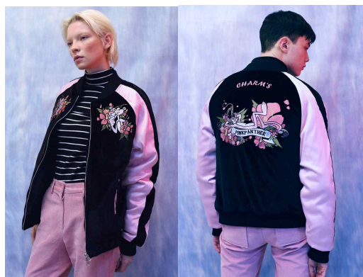
<Fig. 19> Charm's × Pink Panther collaboration collection : New school vintage style (Woo, 2016)