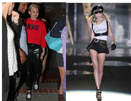
<Fig. 6> Parodies of SWAG on high-fashion DKNY: Change the position of the logotype Dsquared² 2013 S/S : 'Cartier' logo parody (left-Mail Online, 2013, right-Vogue, n.d.-a)