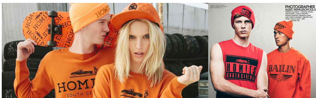
〈Fig. 1〉 'Hermes' and 'Balmain' parody by BLTEE (left-Brian Lichtenberg, n.d.-a, right-Brian Lichtenberg, n.d.-b.)

가볍게 사실(원본)을 반영하고, 다양한 방식으로 사실(원본)을 재현함으로써 사실(원본)과 다른 독립적인 정체성을 가지고 자기만족적이며 자아도취적으로 표현되고 있다.