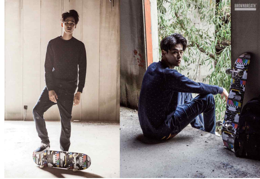
<Fig. 10> Brownbreath 2014 F/W lookbook (Brownbreath, n.d.)