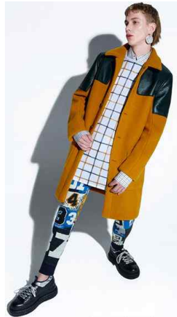
〈Fig. 21〉 Acne Studios 2015 f/w collection (Vogue, n.d.-c)