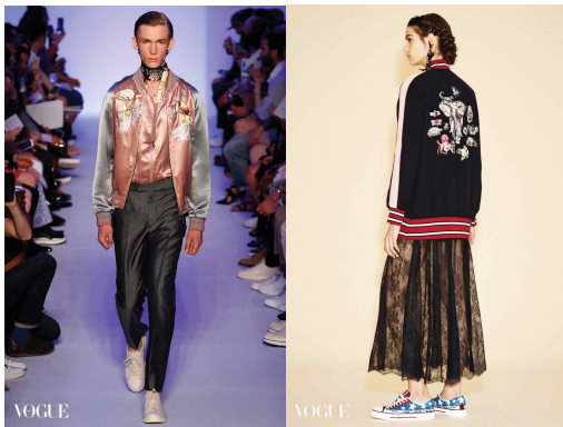
<Fig. 16> Louis Vuitton 2016 s/s, Valentino 2016 resort collection : Sukajyan and Irazumi style (Song, 2015)

그림으로써 표현되는 타투 힙합인 '이레즈미 스타일'은 일본스타일의 회화를 프린팅한 것으로 복식의 넓은 면에 걸쳐 하나의 중심적인 주제를 가지고 화려한 색채로 표현되는 그림이다. 용, 호랑이, 봉황,