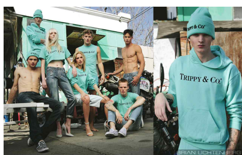
<Fig. 4> 'Tiffany' parody by BLTEE (Brian Lichtenberg, n.d.-e)