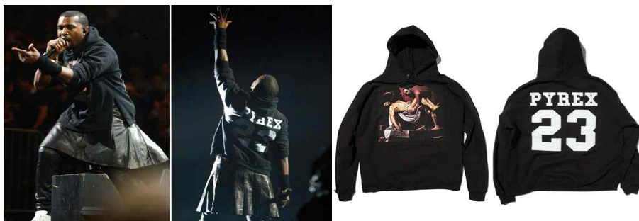
<Fig. 13> Kanye West's Goth hip-hop styling with Pyrex vision hoodie, Givenchy skirt & leggings (Wilson, 2012)

에이셉 라키(ASAP Rocky)가 피날레를 장식하여 화제가 되었던 셰인 올리버(Shayne Oliver)의 HBA(Hood by Air) 2013 F/W 컬렉션에서도 레이어드