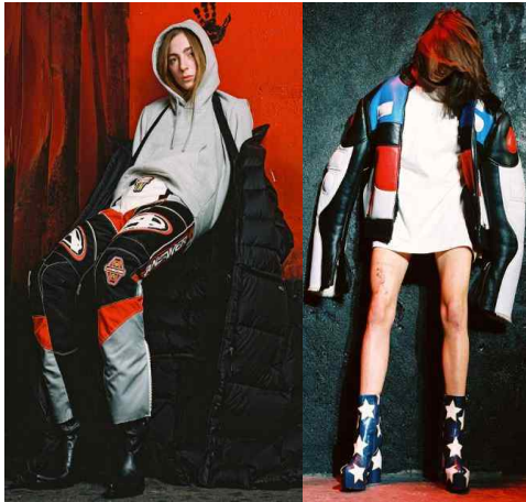
〈Fig. 20〉 Vetements 2015 f/w collection (Vetements, n.d.)