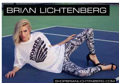
<Fig. 2> Outdoor advertising of BLTEE (Brian Lichtenberg, n.d.-c)