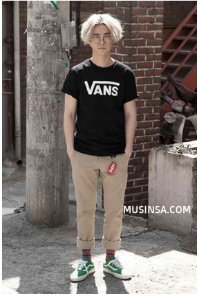
<Fig. 8> skurban hiphop street fashion (Musinsa, 2015.-a)