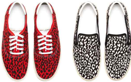
<Fig. 11> Skateboard sneaker by Saint Laurent (Noblesse, n.d.)