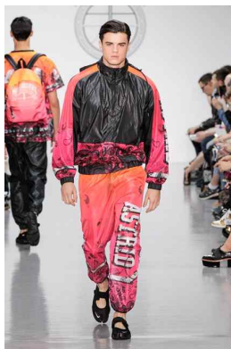
<Fig. 18> Astrid Andersen 2015 s/s collection : Tribal style (Vogue, n.d.-b)