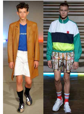
〈Fig. 22〉 Gosha Rubchinskiy 2015 s/s and 2016 s/s collection (left-Vogue, n.d.-d, right-Vogue, n.d.-e)