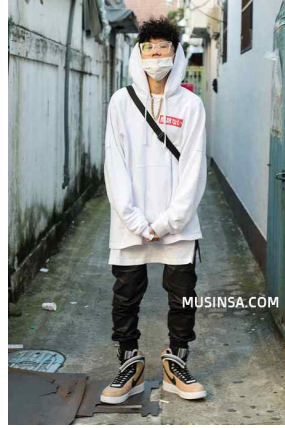
<Fig. 9> skurban hiphop street fashion (Musinsa, 2015.-b)