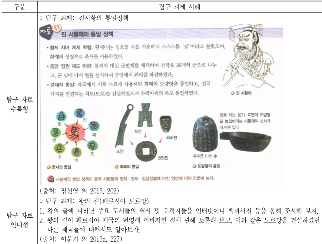
〈표 4〉 중학교 『역사 1』 교과서 세계사 영역의 탐구 과제 제시 사례