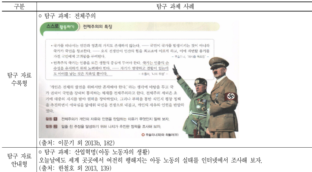
〈표 7〉 중학교 『역사 2』 세계사 영역의 공통 탐구 과제 제시 사례

났다. 탐구 과제 해결 방법은 조사(23회)가 가장 많았으나, 『역사 1』과 달리 특별한 탐구 방법을 포함하고 있지 않은 과제가 절반인 18개에 달했다. 탐구 자료는 본문 수록형 과제인 경우 도서(읽기) 자료(72회), 사진 자료(23회), 지도 자료(17회)순으로 많이 담고 있으며, 탐구 자료 안내형인 경우에는 도서(4회)와 인터넷(4회)을 활용하도록 구성되어 있는 것으로 나타났다. 탐구 결과 표현 방법은 말하기(86회),