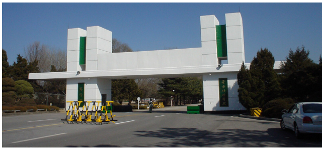
(a) 육군사관학교 정문

이에 정문은 신축과 개축 두 방향으로 사업추진을 고려하고 있다. 첫째, 신축은 미래국방이 느껴질 수 있는 이미지를 표출하기 위하여 군인의 충성심과 강건함을 유지하고자 한옥보다는 수원화성과 같은 성곽의 이미지로 강직함을 보여주려 하였다. 둘째, 개축은 안동 서의문, 경주 툇게이트, 전주 호남 제일문을 사례로 분석하여 전통적인 한