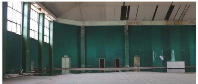
(a) 개선 전

육군사관학교 경계울타리 외곽지역에 구축된 실내테니스 전용코트는 현재 상당히 노후화되어 시설 이용이 불가능한 상태이다. 지붕은 1차 보수가 있었으나 천장마감재가 탈락하여 누수가 발생하고 있는 상황이다.