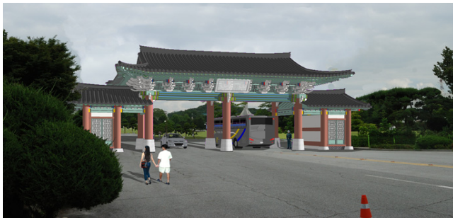
(b) 육군사관학교 정문 신축