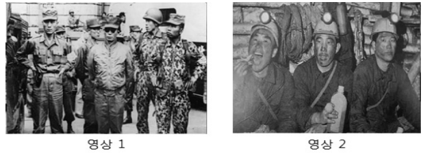
Fig. 2. Test multiview synthesis images

사체의 상반신을 촬영한 영상으로서 피사체의 자세한 표정 변화와 함께 피사체가 주위배경과 어울려 촬영되며 피사체가 어느 정도 움직여도 뷰파인더를 벗어나지 않아 영상 촬영 시 많이 사용되는 웨스트 샷(waist shot) 영상을 선정하였다. 첫 번째 테스트 영상에 비해 두 번째 테스트 영상은 영상의 깊이 정도가 상대적으로 낮은 인물이 확대되어 표현되었다(Fig. 2).