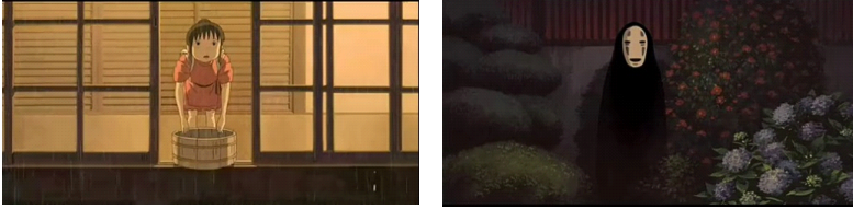
그림 4. 순수한 마음으로 '가오나시'를 대하는 '치히로'

터부시하는 '가오나시'에게 순수한 마음으로 다가간다. '치히로'는 비가 오는 저녁, 비를 맞고 있는 '가오나시'에게 안으로 들어 오라고 한다.