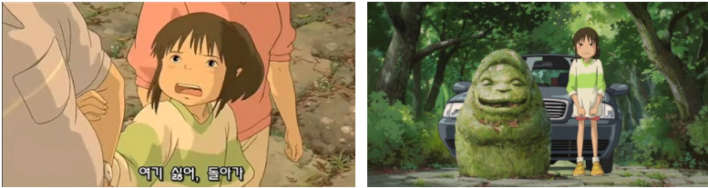
그림 2. 강제된 선택을 하게 되는 '치히로'

<그림 1>에서 '치히로'의 아버지는 이사한 집을 찾다가 길을 잘못 들어선다. 어떤 산의 입구의 길가에 작은 집모양의 돌들이 흐트러져 있는 것을 본 '치히로'는 이것이 무엇인냐고 묻는다. '치히로'의 어머니는 돌로 만든 사당이며 신들이 사는 곳이라고 답한다. 흐트러진 사당을 일견하며 무심하게 대답하는 어머니를 묘사한 장면은 현대인들이 더 이상 신을 찾지 않고 모시지 않음을 시사한다. '치히로'의 아버지는 잘 못 들어선 산길을 무서울 정도의 속도로 달리다가 터널 앞의 석상 앞에 비로소 차를 멈춘다. '치히로'는 어떤 불안감에 부모님과 함께 터널 안으로 들어가기를 거부하지만 터널 앞 석상의 음침하고 괴상한 모습에 마지 못해 터널로 들어간다.