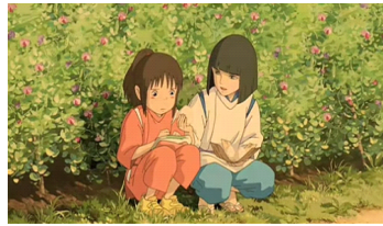
그림 6. '치히로'와 '하쿠'의 모습

하지만 노자는 선악을 구별하지 못하는 ‘주객 미분의 의식 상태’에서 선함을 행하라고 하지 않는다. ‘치히로’의 선함은 단지 선악을 구별하지 못한 상태에서의 행함에서 그치지 않는다. ‘치히로’는 ‘가오나시’의 포악함을 겪었음에도 불구하고 ‘제니바’의 집을 방문하러 갈 때에 ‘가오나시’와 함께 기차를 탄다. 즉, ‘치히로’는 선악의 구분은 알지만 그 차별의 근본을 알기에 거기에 구애되지 않고 자유자재로 살아가는 것을 가능하게 해주는 ‘주객 초월의 의식 상태’임을 알 수 있다. 17)