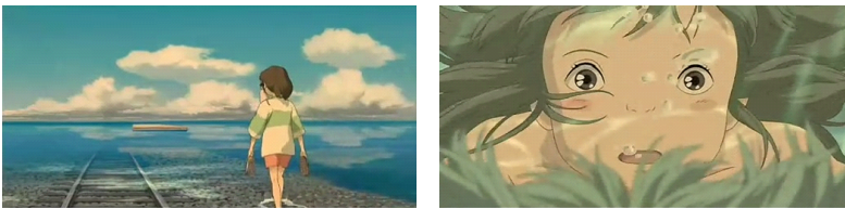
그림 8. 순환, 왕복의 의미를 지니는 물

반면에 물은 순환과 왕복의 의미를 지니고 있다. 두 가지 에피소드에서 물의 의미를 상기시킬 수 있는데, 첫째는 '치히로'가 '제니바'의 집으로 가기 위해 기차를 타는 장면에서 물의 순환과 왕복의 의미를 볼 수 있다. 기차는 물위를 달리며 손님들을 목적지로 데려다 준다. 기차는 물위의 노선을 따라 순환하고 왕복운동을 한다. 즉, 물은 기차와 기차를 탄 손님들을 회귀시키는 역할을 한다. 두 번째는 '치히로'가 아주 어릴 때 고히쿠강에 빠진다. '하쿠', 즉 고히쿠강이자 강의 신은 '치히로'를 물가로 옮겨주고 '치히로'를 회귀시키는 이야기에서 물의 순환과 왕복의 의미를 볼 수 있다.