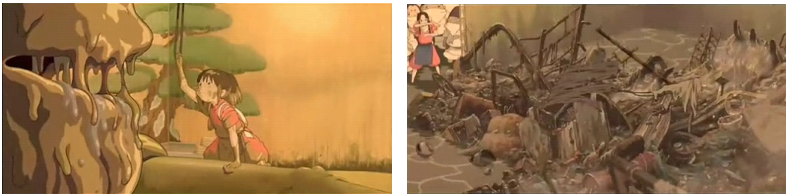
그림 3. 부패신을 목욕시키는 '치히로'와 부패신에게서 나온 생활 쓰레기들

'치히로'가 '구사레가미'를 정성껏 목욕 시키는 장면은 인간의 신에 대한 섬김, 즉 목욕보시로 볼 수 있다. 여기서 한 가지 더 눈여겨 봐야할 점은 부패의 신에서 강의 신으로 돌아올 때 '구사레가미'의 몸에서 쏟아져 나온 오물들이다. 자전거를 비롯한 온갖 생활 폐물들이 '구사레가미'의 몸에서 뿜어져 나오는 장면은 인간에 의해 파괴되어진 자연에 대한 묘사이기도 하다.