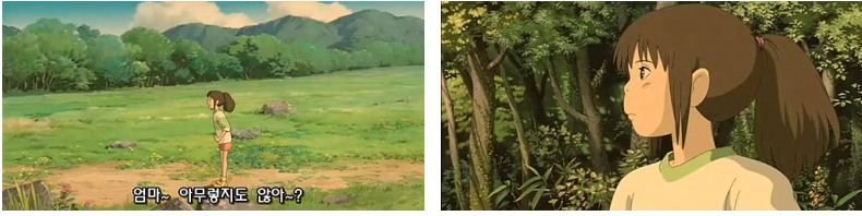
그림 10. 터널을 통과하기 이전과 이후의 '치히로'

'치히로'는 터널을 통과하기 이전에는 엄마의 안부를 물어보지만 터널을 통과한 후, 인간세계로 돌아와서는 마치 아무 일도 일어나지 않은 것처럼 무심하게 터널 쪽으로 쳐다본다. 하지만 '제니바'에게 받은 머리끈은 '치히로'가 신의 세계에서 겪은 일들이 환상이 아님을 말해준다. '치히로'는 비록 원래 있던 인간 세계로 돌아왔지만 신의 세계를 겪은 '치히로'는 터널을 통과하기 이전의 '치히로'와 같을 수 없다. 『도덕경』과 『성서』에서 말한 모든 것을 알지만 아무것도 모르는 상태로 돌아온 것이다. 미야자키 하야오 감독은 순환적이지만 발전하는 세계관을 '치히로'를 통해 보여주고 있다.