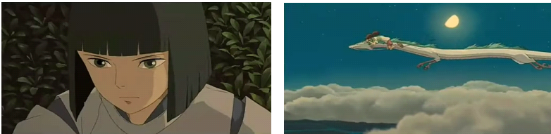
그림 9. '하쿠'의 어린아이의 모습과 용의 모습

용은 또한 “생명에 대한 원형은 물이며 사람들 마음속에 있는 생명의 근원에 대한 이미지” 라고 말을 한다. 21) 미야자키 하야오 감독의 '하쿠'에 대한 묘사와 용의 물의 무의식적 상징에 대한 개념은 너무나도 잘 맞아 떨어진다. '하쿠'는 강의 신으로서 용의 모습과 아직 성별이 미분화된 아이로 묘사된다. 즉, 수룡의 형태와 음의 여성적 모습이 흡수된 양의 남성적 모습의 형태이다. 또한 '하쿠'는 인간세계의 '치히로'를 구해줬으며, 신의 세계에서는 '치히로'를 인간세계로 돌려보내는 역할을 한다. '하쿠'의 역할과 모습은 일본적 사유에서 탄생한 것이 아니라 동양과 서양을 초월하여 인간 본연의 무의식적 사유에서 탄생한 캐릭터가 아닐까라고 생각한다.