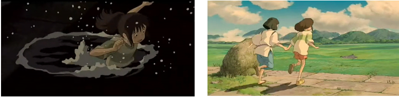
그림 7. 사망의 물과 들판으로 바뀐 장소

하지만 물이 '치히로'의 진로를 방해한다고 해서 부정적 의미의 '사망'의 개념이 아니다. 부활을 위해 사망의 단계가 필요한 것처럼 사망의 물은 '치히로'가 인간세계로 돌아가기 위해 거쳐야 하는 단계적 과정으로 이해할 수 있기 때문이다.