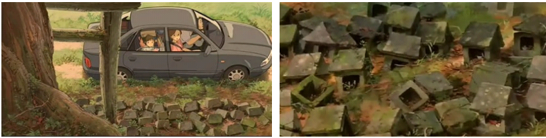
그림 1. 길을 잘 못 들어선 '치히로' 가족과 흐트러진 사당

가미가쿠시의 또 다른 해석에 대해서는 도교적 요소를 들 수 있다. 도교는 중국 고대의 애니미즘 12) 또는 샤머니즘 13) 을 바탕으로 민간신앙과 역, 음양, 오행, 무속신앙 등의 개념과 합쳐져서 형성되었다. 도교의 대표적인 특징은 토속적인 다신(多神)의 존재이다. 고대 일본에는 헤아릴 수 없을 정도의 수많은 신들이 존재했지만 메이지 유신 이후 내각은 천황을 정점으로 하는 전제 국가의 성립을 위해 그 동안 서민들이 받들던 씨족신이나 마을 수호신 같은 소박한 민간 신앙은 부정되고 탄압하기 시작했으며, 현대의 합리적인 이성이라는 명분이 가세하여 신들은 점점 더 잊혀지고 소외되는 존재가 되었다. 14) <센과 치히로의 행방불명>에는 인간에 의한 신의 소외에 대한 장면이 나온다.