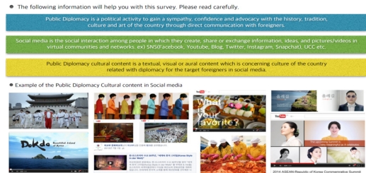
그림 2. 대한민국 공공외교 콘텐츠 예시 이미지

설문지의 문항 구성은 소셜 미디어의 속성(상호작용성, 신뢰성, 유희성, 신속성, 참여성)에 대한 15문항, 공공외교 문화 콘텐츠 호감도에 대한 5문항, 국가 이미지에 대한 14문항, 국가 브랜드 호감도에 대한 4문항 국가 브랜드 로열티에 대한 3문항, 응답자의 인구통계학적 특성에 대한 9문항, 이용 특성에 관한 6문항으로 총 56 문항으로 구성하였다. 또한, 외국인을 대상으로 설문을 진행하는 만큼 대한민국의 공공외교 콘텐츠에 대한 이해를 돕기 위해 다음과 같이 예시를 제시하여 연구의 타당성을 확보하고자 하였다.