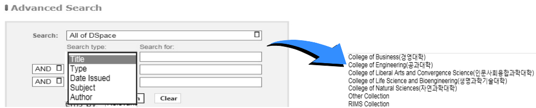
<그림 5> DSpace의 상세검색 요소와 필드제한 사례(대학도서관 B)

다음, 검색에 직접적으로 사용되는 검색 요소를 살펴보았다. 그 결과, 키워드 검색 중 간략 검색에서는 ‘표제’, ‘기여자’, ‘주제’ 요소를 검색에 활용하고 있었다. 또한 상세검색에서는 기관에 따라 적게는 3개(표제, 기여자, 날짜)에서 많게는 5개(표제, 기여자, 날짜, 자료유형, 주제)의 요소를 검색에 활용하고 있었다. 또한 필드제한 검색기능도 제공하고 있었는데, 대학도서관 B에서는 ‘단과대학별 혹은 하위 기관’에 따라 그리고 나머지 3개 기관에서는 ‘자료유형’에 따라 검색하도록 하고 있었다(<그림 5> 참조).