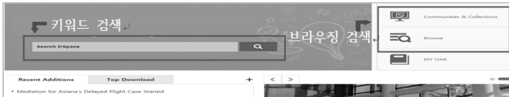
<그림 3> DSpace 검색 방식

흔히 검색 방식은 특정 검색 능력을 보유하고 있는지의 여부로 결정된다. 이러한 검색 능력의 대표적인 요소는 키워드 검색과 브라우징 검색으로 대별되는 탐색질의 방식이 있다(김효정 2000, 56). 이러한 방식에 따라 살펴보면 조사 대상인 4개 기관 리포지토리 모두에서 키워드 검색과 브라우징 검색 기능을 기본적으로 제공하고 있었다(<그림 3> 참조). 그러나 키워드 검색 중 상세검색 기능의 제공여부는 기관 리포지토리 간에 차이가 존재하였는데, 조사 대상 중 3개 기관에서는 상세검색 기능을 제공하고 있는 반면, 1개 기관에서는 간략검색 기능만을 제공하고 있었다.