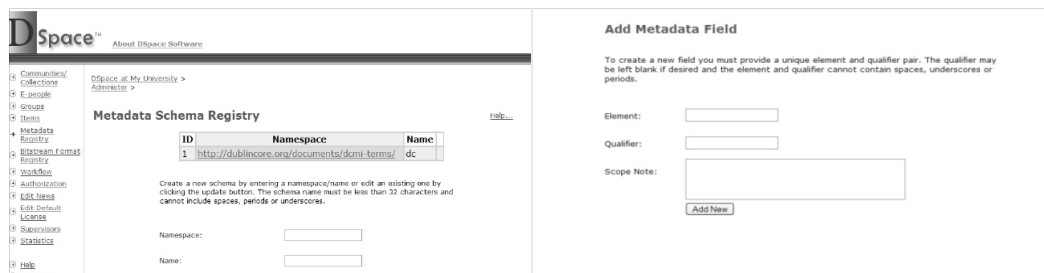
<그림 1> DSpace 메타데이터 요소 확장 화면

DSpace는 메인 홈페이지로부터 필요한 프로그램을 일괄 다운받는 턴키방식(turn-key approach)을 적용하고 있다. 1) 따라서 다른 시스템에 비해서 상대적으로 쉽게 설치할 수 있는 소프트웨어라는 평가를 받고 있다(Castagné 2013, 2). DSpace 설치 후에는 자관이 필요로 하는 메타데이터를 커스터마이징 할 수 있다. 가령, <그림 1>과 같이 새로운 메타데이터 요소를 추가하고자 할 경우 네임 스페이스와 이름을 입력하면 바로 요소가 생성이 되는데, 이 때, 해당 시스템에서 활용할 요소명과 필요하다면 한정어와 주기를 추가할 수 있다.