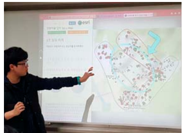
(바) 소그룹별로 산출물(스토리 맵)을 통해 조사결과를 발표하고 공유