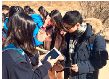
(다) 그룹별 활동을 시작하기 전 소그룹별로 데이터 수집전략 논의