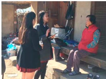
(라) 주민들과의 인터뷰