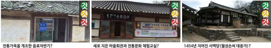
그림 2. 카드 분류활동을 위한 카드(일부)

도 밀접하게 관련 있기 때문에 학생들에게는 ‘변해야 하는 것과 변하면 안 되는 것’에 대한 이해가 구체화되며, 양동마을에서 수행해야 할 문제해결과도 유사한 경험이 된다.