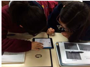
(나) Collector 활용방법 연습