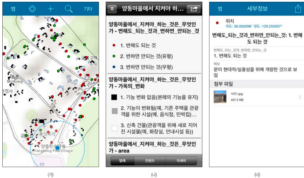
그림 1. 양동마을 프로그램에 사용된 Collector 앱의 활용 모습