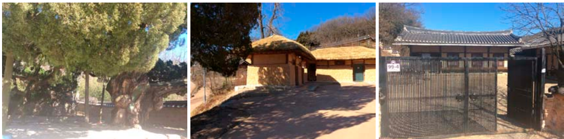
(가) 건물과 더불어 오랫동안 유지되고 있어요. 전통으로 변하면 안 됨.

그림 4는 세계유산 양동마을에서 ‘변해야 하는 것과 변하면 안 되는 것’에 맞춰 학생들이 입력한 결과물의 일부이다. 한편, 조사 내용, 개수, 방법 측면에서 그룹별로 약간의 차이가 발견되었다. 가령 설명(메모)없이 사진만 올리거나, 간단한 설명(예, ‘우물 속 쓰레기’), 혹은 비교적 상세하게 서술한 사례들(예, ‘다른 집들과 비교해 보았을 때 조금 인위적인 느낌이 강하고 콘크리트와 같은 소재들이 조화롭지 못함’)이 관찰되었다. 그룹에 따라서는 여러 장의 사진(1~5)이나 주민 동영상도 첨부한 사례(1건)도 있었다. 동일한 경관에 대해 다르게 해석한 사례들도 발견되었다. 예