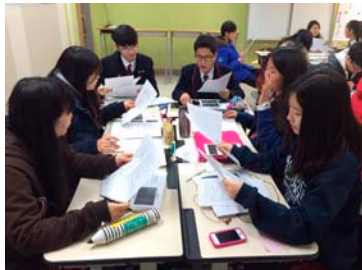
(가) 소그룹별로 인터뷰 문항 개발

데이터 수집을 위해 학생들은 식사시간을 포함하여 약 5시간 30분 동안 양동마을에 머물렀다. 4개의 그룹(A~D)은 각각 5~6명으로 구성되었으며 이들은 다시 2~3명씩 팀 단위로 조사할 구역을 나눠 필요한 데이터를 수집하였다. 1팀(2~3명으로 구성)당 1대의