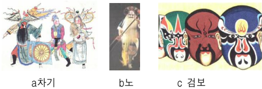
<그림 1> 경극

경극은 청나라 시대 각 지역에 분포되어 있던 연극이 베이징에 모여 재편성되면서 지금의 경극 형태로 발전되었다. 무대에서는 배우의 춤추는 과장된 동작을 통해 시간과 공간이 상징적으로 표현된다 7) . 무대의 소품 또한 상징성을 띠고 있는데 바퀴가 있는 깃발(車旗) 두개는 마차, 말채찍은 말, 노는 배를 상징한다<그림 1-ab>. 등장인물은 검보(臉譜)<그림 1-c>분장법에 따라 빨강은 용맹, 보라는 신중, 검정은 충성심 강한 사람을 뜻하는 등 상징성이 크다.