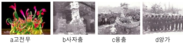
<그림 2> 민속무

중국 전통무용은 고전무와 민속무로 나누어지고 고전무는 국가의 큰 축제때 쓰는 아무(雅舞)와 오락용 무용인 잡무(雜舞)로 나누어진다 8) . 민속무에는 용춤(舞龍), 사자춤(舞獅), 양가춤(秧歌), 등이 유명하다.<그림 2>