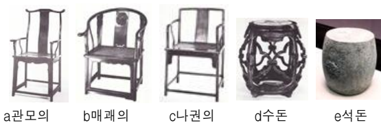
<그림 8> 전통 가구

중국의 가구는 명청시대에 고도로 발전되어 다양한 침상/탁상, 의, 등, 탁자/안, 주계, 병풍, 대가 등이 모두 출현하였으며 대부분 목재와 칠 그리고 옥, 도자기, 금속, 돌로 만든 가구도 있다. 중국은 입식생활로 대표적 의자는 관모의(官帽椅)<그림 8-a>, 매괘의(玫瑰椅)<그림 8-b>, 나권의(羅圈椅) <그림 8-c> 등과 등받이 없는 돈(墩)<그림 8-de>도 있다.