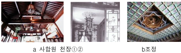
<그림 7> 전통 천장

사합원의 천장 형태는 목구조 가구에서 도출된 양쪽 경사를 노출시키는 것과 평천장으로 나눌 수 있다. 궁전 천장은 사합원의 기본 구조 외에 가운데 우물천정인 조정(藻井)을 설치하는데 사각형, 다각형, 원형이 주로 많으며 주변에 花藻井무늬 및 다양한 조각과 채화로 장식한다.<그림 7>