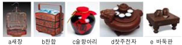
<그림 11> 전통 장식품

중국의 장식품은 서예, 회화, 도자기, 조각, 자수, 비단, 중국결은 물론 새장, 찬합, 술항아리, 바둑판, 찻주전자 등의 생활용품 외에 경극 금보 가면도 장식품으로 사용되고 있다.<그림 11>