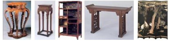
<그림 9> 전통 가구

그리고 다양한 주계, 상자, 침대, 침상, 탁자, 의가 등과 장대가, 장식장, 제대안, 병풍<그림 9>등도 있다.