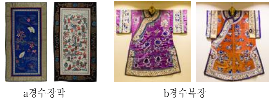
<그림 3> 경수

경수(京繡)는 전통 자수로 궁전의 실내장식과 복식에 많이 사용하였다. 비단에 자수 도안으로 가득 채웠으며, “圖必有意、紋必吉祥” 9) 의 종지를 따라야 하는데 입는 옷의 도안, 무늬와 색깔은 명확한 규범이 있고 ‘오조금용(五爪金龍)’은 황실만 쓸 수 있는 도안이다.<그림 3>