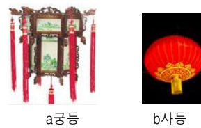
<그림 10> 전통 조명

중국의 전통 조명기구는 궁궐에서 사용되는 금. 은으로 화려하고 정교하게 만든 궁등(宮燈)과 일반에서 사용하는 홍등룽(紅燈籠)으로 대표되는 사등(紗燈)이다.<그림 10>