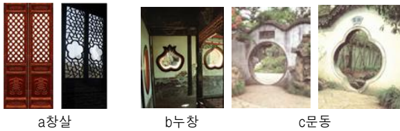
<그림 6> 전통 창/문

원림의 담에는 다양한 형태의 문과 창문이 있고 또 문동(門洞)과 누창(漏窓)도 다양하다.<그림 6-bc>