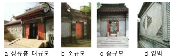
<그림 5> 전통 대문 구조

사합원의 대문은 문루(門樓), 문동(門洞), 대문, 문틀, 문턱, 문발, 문정(門釘), 문련(門聯), 문둔대(門墩) 등으로 구성한다. 목재로 된 대문은 부를 상징하는 붉은색으로 채색하며, 다양한 문양으로 장식하는데 문둔대의 바깥 부분은 조각으로 장식한다. 보통 대문 앞에는 주택 보호의 풍습으로 사자 두 마리를 양쪽에 둔다. 사합원의 대문을 들어서면 바로 보이는 벽인 영벽이 있다.<그림 5>