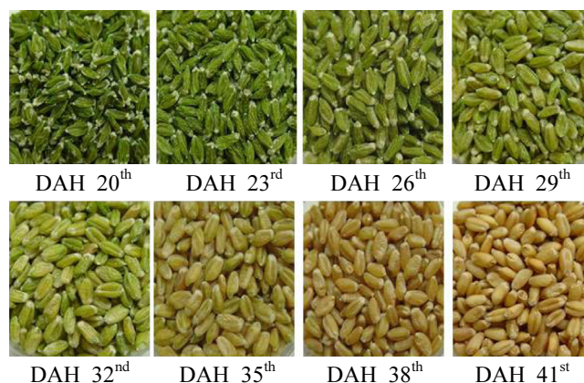
Fig. 2. Change in the color of wheat grains blanched on various harvesting dates. DAH refers to the day after heading.

출수 후 경과일수에 따른 금강밀 품종의 녹색통밀의 색도와 엽록소 함량은 Table 1과 같다. 색도는 색차계를 이용하여 표준색판(D65 Y=93.9 , x = 0.3152 , y = 0.3314 )으로 보정한 후 명도(Lightness, L), 적색도(Redness, a), 황색도