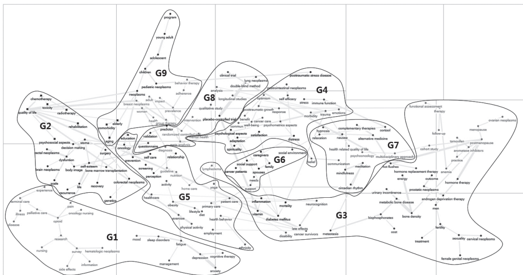
G1=Cancer-related symptoms and nursing; G2=Cancer treatment-related issues; G3=Late effects; G4=Psychosocial issues; G5=Healthy living managements; G6=Social supports; G7=Palliative cares; G8=Research methodology; G9=Research participants.

네트워크 분석 방법에서 가장 먼저 수행되는 검색을 위해 중요한 것은 검색어의 선정이다. 대장암 연구 네트워크 분석[19]과 암유전자 연구 네트워크 분석[20]에서는 Pubmed에서 관련된 MeSH 용어로 검색하였으며, 암 환자의 건강 관련 삶의 질 연구 네트워크 분석[21]에서는 WoS에서 'quality of life'와 5개 암종으로 제한하여 검색하였다. 이렇게 선정된 검색어에 따라 연구자의 의도가 크게 반영될 수 있으므로 본 연구에서는 이러한 편향성을 배제하기 위해 큰 개념을 설정하고 각 개념의 양상을 도출하여 전개하였다. 이렇게 선정된