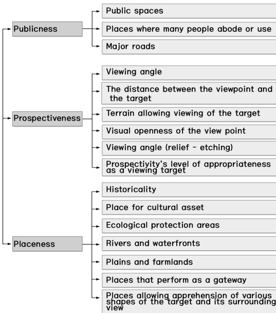
Fig. 2. AHP hierarchy of the selected viewing point

AHP 분석프로그램을 통해 중요도를 제시하고 제시한 쌍별비교 설문에 대한 일관성 지수(CL: consistency ratio)는 모두 0.1보다 현저히 낮아 응답자의 일관성이 높고 신뢰할 수 있는 것으로 나타났다.