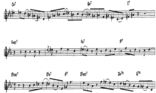
Fig. 6. The 6th Solo of the Solar

네 번째 박자는 ‘라’에서 ‘b라’로 Chromatic Approach하였다. 열두 번째 마디는 Dm7b5 코드의 두 박자는 D Locrian Scale이고, 첫 음인 ‘#파’는 그 다음 음인 ‘솔’로 Chromatic Approach하였다. 세 번째 박자와 네 번째 박자는 G Mixo-Lydian Scale을 사용하면서 Double Chromatic Approach하였다.[12]