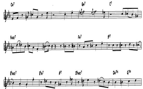
Fig. 2. The First Solo of the Solar

그림2는 기타 솔로가 시작되는 첫 번째 코러스이다. Head의 앞부분이 C Melodic Minor Scale을 사용하였으므로 솔로 도입부에서부터 C Melodic Minor Scale을 사용 하는 것이 당연하다고 추측을 할 수도 있지만 의외로 첫 번째 마디에서 C Natural Minor Scale을 사용하였다.[1]