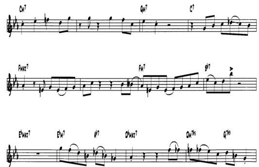
Fig. 4. The Third Solo of the Solar

열 번째 마디는 Eb Dorian Scale과 Ab Mixo-Lydian Scale을 사용 하였고, 열한 번째 마디에서는 Double Chromatic Approach를 사용하여 Chromatic한 느낌을 내면서 코드 톤인 ‘b라’로 진행 하였는데, 이 ‘b라’에 액센트(Accent)를 줌으로써 Chromatic에서 코드 톤으로 진행 하는 것을 강조 하였다. 열두 번째 마디에서는 그 앞의 마디에서 사용한 Double Chromatic Approach를 방향을 바꾸어 하행함으로써 다른 느낌을 주고 있다.[5]