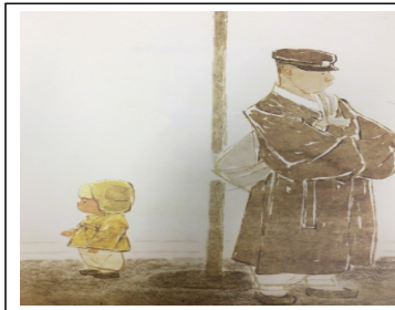
(그림 11) 신념적 용기 '엄마 마중' 중에서

왕자를 구하는 모습을 보여준다. 하지만 왕자는 엉망이 된 공주의 겉모습을 보고 편잔을 주게 되며 이에 화가 난 공주는 왕자에게 “넌 걸만 번지르르한 껌데기야”라고 말하고 결혼을 취소한다. [그림 9]는 종이 봉지 공주 이야기의 마지막 장면으로 공주는 자신의 신념에 맞지 않는 왕자를 망설임 없이 포기하고 신나는 발걸음으로 뒤돌아서 걸어가는 모습을 보여준다. 이와 같은 장면은 엘리자베스 공주 개인의 가치관과 판단에 근거한 용기 있는 행동을 그대로 반영한 장면으로 이를 통해 엘리자베스 공주는 자신의 가치를 실현할 수 있는 의미 있는 세상으로 나아가게 될 것이다. 이 또한 앞서 제시한 Episode와 마찬가지로 본 연구를 통해 살펴보고자 한 신념적 용기의 속성을 충분히 반영하고 있는 대표적인 Episode라 볼 수 있을 것이다. 그리고 이와 같은 Episode를 경험한 유아들은 그림책의 교육적 가치를 고려할 때 자신의 가치와 신념에 기반한 용기 있는 선택과 판단의 중요성 그리고 이에 따른 행동의 가치와 긍정적 결과를 간접적으로 인식하고 경험하는 기회를 제공받게 됨으로써 이를 자연스럽게 습득할 수 있을 것이다.