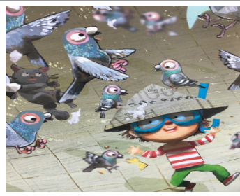
(그림 15) 창조적 용기 '용기 모자' 중에서