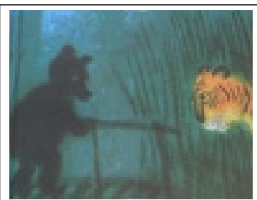
[그림 7] 신체적 용기 ‘용기의 산’ 중에서