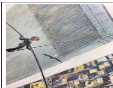
[그림 5] 신체적 용기 ‘쌍둥이 빌딩 사이로 걸어난 남자’ 중에서

‘헨젤과 그레텔’의 주인공인 헨젤과 그레텔, ‘종이 봉지 공주’의 엘리자베스 공주, ‘난 자신 있어요’의 꼬맹이, ‘어린이를 위한 용기’의 아이, ‘용기의 산’과 ‘까마귀의 용기’의 까마귀는 모두 공통적으로 개인의 성취나 성공, 위험한 상황으로부터의 극복 혹은 문제해결 등을 목적으로 어려운 상황에 굴복하지 않고 행동하는 용기 있는 모습을 보여준다. 따라서 이들 그림책을 읽게 되는 유아들은 신체적 용기 발현의 간접 경험을 통해 자연스럽게 다른 사람의 용기 있는 행동과 그때의 감정과 상황을 이해하는 경험을 제공받게 되고 이를 통해 신체적 용기에 대한 새로운 가치와 태도를 기를 수 기회를 제공받게 되는 것이다. Schickedanz(1986)는 그림책의 교육적 가치로 문해 능력의 발달, 상상력과 추론능력의 발달과 더불어 간접경험이 주는 교육적 가치의 중요성을 강조한 바 있다. 따라서 그림책을 통해 유아들에게 제공되는 신체적 용기와 관련된 간접경험은