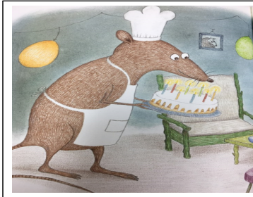
(그림 14) 사회적 용기 '용기가 필요해' 중에서