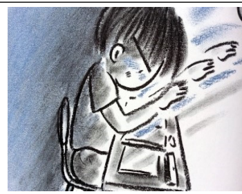
(그림 12) 신념적 용기 '틀러도 괜찮아' 중에서