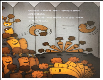
(그림 16) 창조적 용기