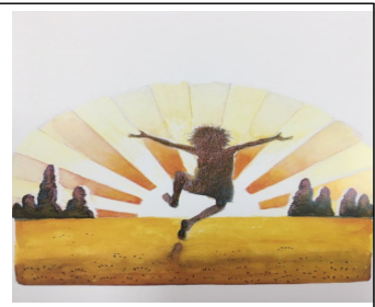
(그림 13) 신념적 용기 '종이봉지 공주' 중에서