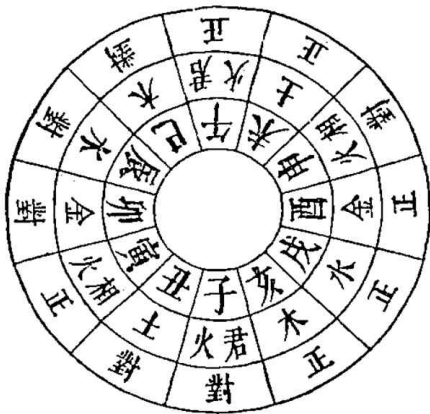
Fig. 1. The proper place creation and the opposite place creation of the six kinds of Natural Factors.

위의 내용은 亥는 水生木하고 寅은 木生火하여 正化가 되고 午, 未, 酉, 戌은 모두 火, 土, 金, 水가 왕성하게 작용하는 본래자리이기 때문에 正화가 된다는 것이다. 『현주밀어』는 同篇에서 “正司化之實하고 對司化之虛라.(정화는 화령의 실을 관장하고 대화는 화령의 허를 관장한다.)” 18) 고 하였고 또 만물은 “從其本而生하고 從其標而成”하는데 “正화가 본이 되고 對화가 標가 된다”고 하였다. 따라서 여기에 붙이는 숫자는 “生하여 본이 되는 正化에는