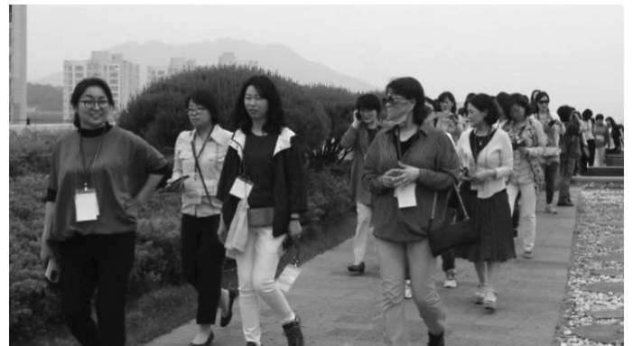
세종시 행복도시를 방문한 대한여성건축사회 회원들

대한여성건축사회가 주관하는 제21차 전국여성건축사대회가 지난 5월 15~16일 1박2일 일정으로 충남 부여에서 열렸다.