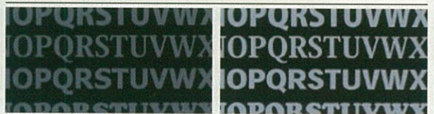
오프셋 인쇄(1패스)에 의한 인쇄(클리어 토너 없음)