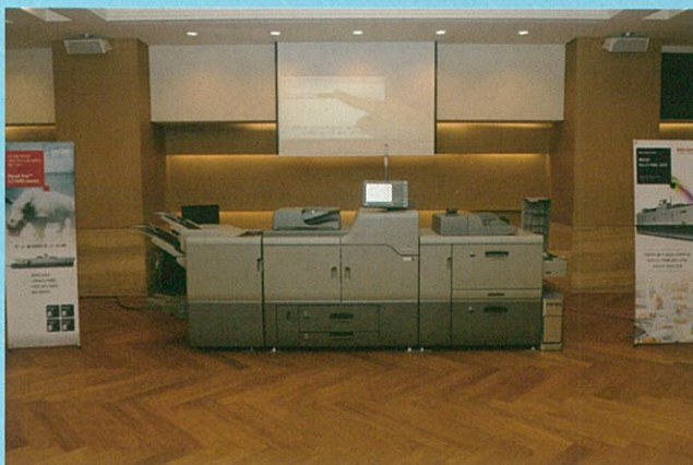
리코 프로 C7100S

리코 프로 C7100S 시리즈는 분당 최대 90/80페이지(A4기준)의 높은 생산속도를 낼 수 있다. 우리나라 대부분의 디지털 인쇄사가 월 10만 페이지(A3) 미만으로 출력하는 상황에서 최적의 생산성이라고 할 수 있다. 그리고 용지두께 300g/m 2 까지 분당 90/80페이지의 높은 속도를 유지하고, 300g/m 2 ~360g/m 2 까지는 분당 75/65페이지의 속도를 유지한다. 용지두께가 변해도 출력속도를 일정하게 유지하기 때문에 생산성 측면에서 더욱 만족할 수 있다. 출력속도뿐만 아니라 고객 스스로 장애 부분을 교체해 사용할 수 있도록 사용자 교체 유닛(TCRU)을 지원함으로써 장애 발생 시 고객이 리코의 서비스팀을 기다리지 않아도 되기 때문에 다운타임을 크게 줄였고 이에 따라 높은 생산성을 보장한다.