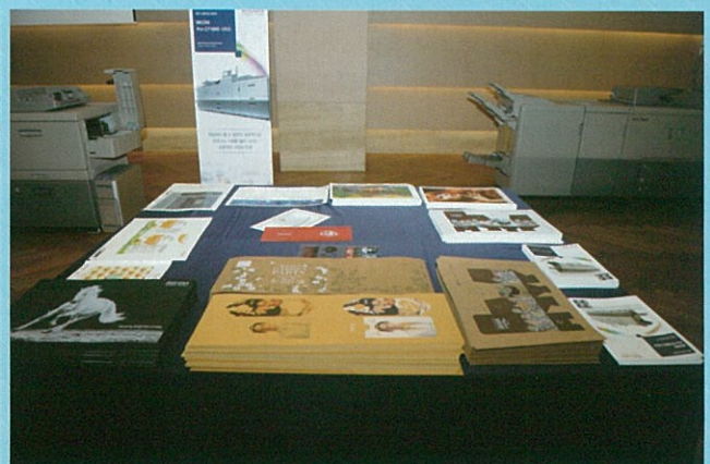
리코 프로 C7100S 시리즈 샘플

일본에서 개최되는 IGAS는 과거에 비해 규모가 감소해 사람들의 관심도 낮아지고 있다. 하지만 IGAS는 여전히 다양한 인쇄장비와 솔루션을 개발하고 출시하는 일본에서 개최되기에 보다 광범위한 고객 사례나 적용 상품에 대한 정보를 접할 수 있는 전시회다. 리코는 본사가 일본에 있는 만큼 IGAS에 대한 관심이 크며, 현재 리코의 판매 제품과 출시 예정 제품을 전시할 것으로 보인다. 컬러, 흑백 날장용지뿐 아니라 사이너지 시장을 목표로 한 그래픽 아트용 와이드포맷 제품도 출시할 계획이다.🔄