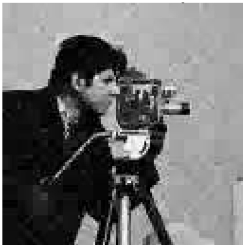
그림 3. AMP를 통한 복원 후 이미지.