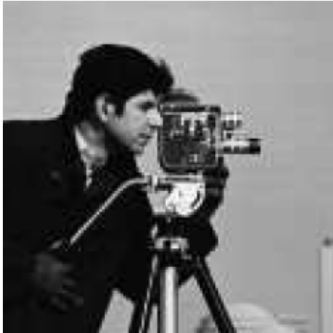
그림 2. 원본 이미지.