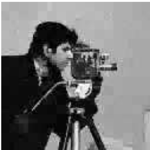
그림 4. SS CoSaMP를 통한 복원 후 이미지.