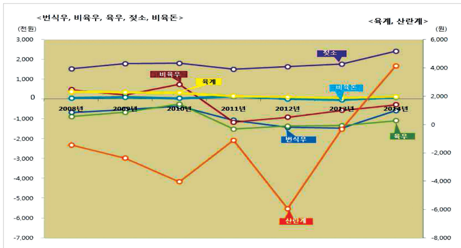
〈도표 2〉 최근 7년간 순수익 추이