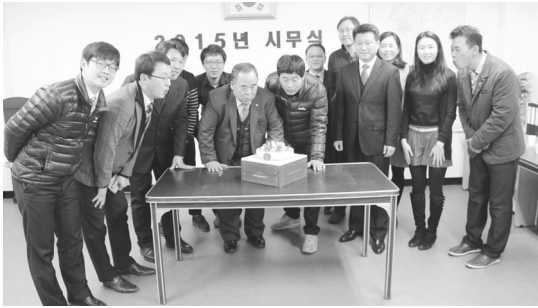
▲ 2015년도 시무식