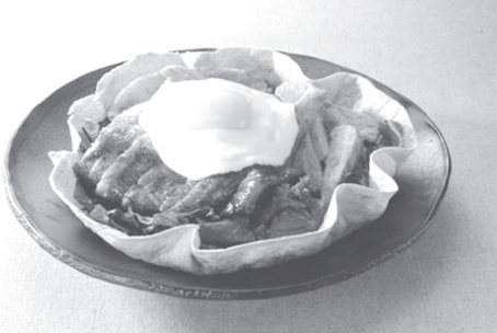
▲덕샐러드 인 또띠아 플레터