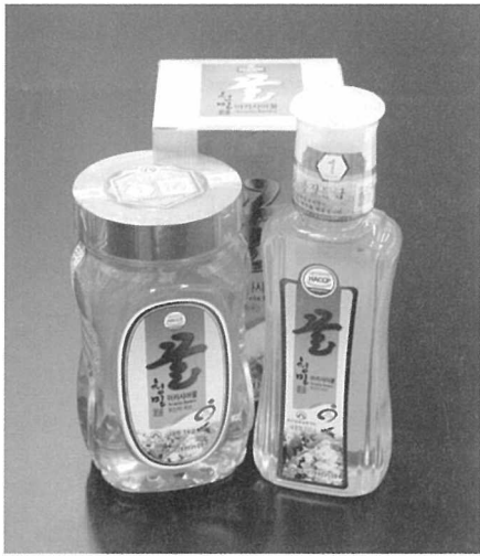
믿을 수 있어 더 좋은 그대, 허니~