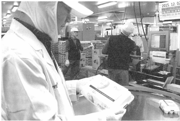
생산된 등급란 제품을 살펴보고 있는 평가사

열기가 뜨거웠다. 도착한 시간에는 경기지원의 특징 중 하나로 꼽을 수 있는 부분육 경매를 준비하고 있었다.