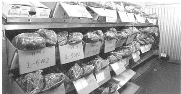
중매인들이 볼 수 있도록 열어둔 부분육 샘플

일단 내비 안내에 냅다 핸들을 꺾었다가 공사장 통행로로 잘못 들어가는 바람에 덤프트럭 행렬사이에서 호떡이 될 뻔했다. 혹시 방문 계획이 있으신 분은