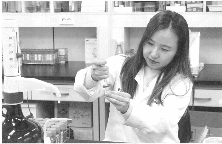
판정을 위한 실험 중인 평가사

유일한 꿀등급제 품질검사 기관답게 작업환경은 연구실, 그 자체다. 들어오는 밀원으로는 아카시아가 가장 많은데, 이날은 계절 탓인지 피나무, 때죽과 같은 특수밀원이 많아 볼거리를 더했다. 아카시아나 밤 같은 주요 밀원의 채밀이 다 끝나 비수기라지만 엇그제 93드림의 등급판정 신청이 들어왔다는 이곳은 여기저기 검사를 위한 샘플이 가득했다.