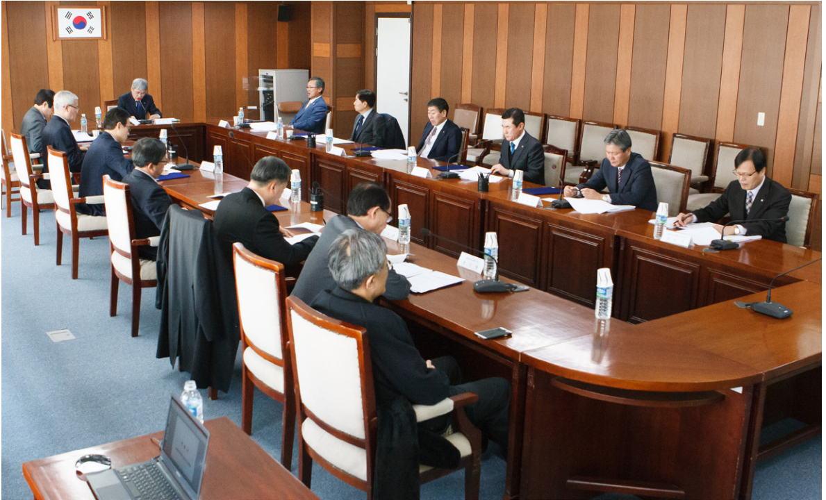
대한기계설비산업연구원은 지난 2월 26일 설비건설회관 중회의실에서 2015년도 제1차 이사회를 개최했다