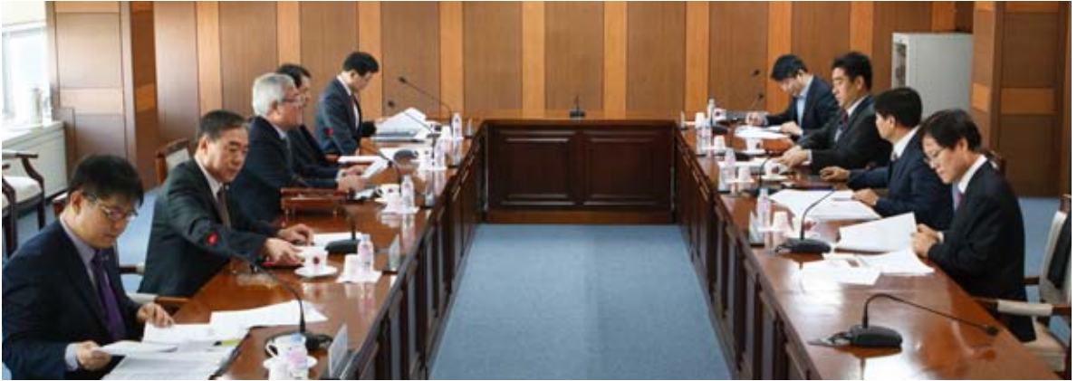
대한설비건설공제조합은 지난 12월 8일 자금운용위원회를 설치하고 운용위원을 위촉했다