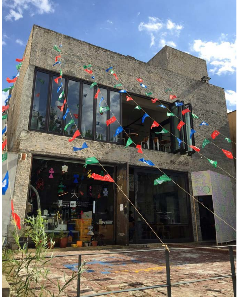
책집외부 플래그_ 수차례 강제집행 후 다시 재건한 테이크아웃드로잉, 2015 가을

북동 동숭동에 이어 세 차례 겪으면서 더 이상 내몰릴 수 없었다. 이 장소를 박탈당한다는 것은 드로잉에게 위기이다. 작고 오래된 가게들의 권리를 찾기 위해 드로잉은 이 사태를 세상에 알리며 오늘도 한남동 현장을 지키기 위해 싸운다. 거리로 내몰리는 우리와 똑같은 이웃들의 현장에 참여한다. 거리에 선다. 모든 재난은 연결되어있다. 장소를 잃고 터전을 잃고 뿌리를 거세당하고 기체 상태로만 예술이 가능한 걸까? 내몰린 예술은 우리의 삶을 어떻게 구성하게 될까? 사태에 공감하는 친구들을 통해 다시 겸손하게 세상을 배우고 [테이크아웃드로잉을 지키기 위한 대책위원회]를 꾸리고, 좌담회 형태의 [한남포럼]을 열면서 건물주와의 분쟁 상황을 사회적 의제 및 예술로 확장시킨다. 드로잉이 그러하듯 스