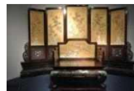
<그림 11> 청 왕조 스크린 - 상해박물관 전시실