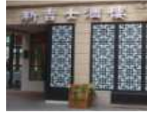
<그림 20> 현대식건물에 전통창호적용 파사드