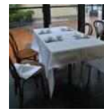
<그림 27> 현대식 테이블과 의자