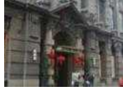
<그림 21> 유럽건축양식 파사드

영문상호 표기40%(6사례), 검정현판에 금색 한자서체 34%(5사례), 한자영문병행(4사례)로 나타났다. 현대적 건물양식의 레스토랑도 간판에 한자서체를 사용<그림 20>하거나 유럽 건축양식 건물에도 홍등<그림 21>을 걸어 중식 레스토랑임을 인지시켜 주고 있었다.