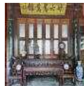
<그림 2> 유교영향 - 대칭적 가구배치

Kan(heaven) yu(earth)라고 알려져 있는 풍수의 개념은 공간구성, 계획, 구조, 실내디자인을 인간의 행위에 가장 자연스럽게 딱 들어맞는 환경을 창출해내려는 의도와 함께 적용되는 기(氣), 에너지라고 할 수 있다. 위치(부지)선정 부터 건축 계획, 건물형태, 개인방의 형태, 색채의 선정과 조합, 길상의미 장식 배치<그림 6>, 입구의 스크린<그림 7> 또는 식물 배치 등의 방법으로 적용되었다. 이는 건강한 몸과 마음을 가져오고 나쁜 기를 막는데 효과적인 방법이라 생각한 것이다.