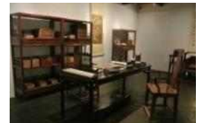
<그림 10> 명 왕조 서재와 가구 - 상해박물관 전시실