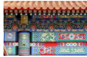
<그림 17> 궁궐건축 외관 색채