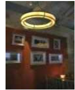
<그림 28> 상해역사담은 사진 장식