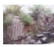
<그림 3> 도교영향 - 정원