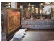
<그림 15> 전통문양 투각 스크린, 석상