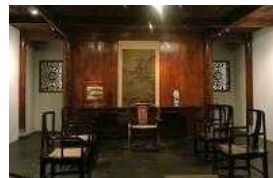
<그림 9> 명 왕조 접견실가구 - 상해박물관 전시실

중국의 전통가구는 비율과 미적 법칙을 강조하는데 의자류 가구를 중심으로 전반적인 형태와 부분적인 분할, 규모에 최적화한 비례 등 미학적 원칙이 특징이다. 11) 산업의 발달과 함께 동남아시아의 목재수입으로 재료가 풍부해진 시대인 명, 청시기에 가구가 발달하였고, 지금까지도 단순한 형태와 선이 특징인 명대(明代) 의자, 조각과 장식이 풍부해진 청대(清代)의 장의자와 스크린 등이 대표적이다.