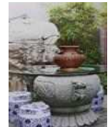
<그림 4> 도교영향-자연동경