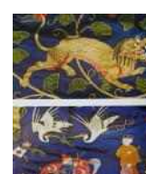
<그림 6> 길상의미 자수장식