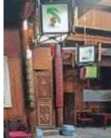
<그림 13> 궁등 문양 장식, 黼 문양 쿠션