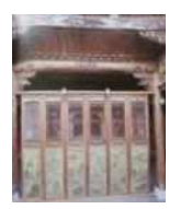
<그림 7> 풍수영향-입구시선 차단