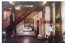
<그림 16> 석조장식