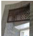
<그림 25> 사각 프레임+전통문 양 프레임 창