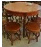
<그림 26> 전통 테이블과 스툴형 의자

소품으로는<그림 28>처럼 상해의 역사적 발전과정을 보여주는 사진을 액자에 넣어 장식의 용도로 활용하는 사례(사례 2,6,7,13)가 있어 인상적이었다. 이러한 표현특성에 영향을 끼친 인자로는 사상적 요소로는 중국 문화의 정신적 기초를 이루는 유교와 도교사상의 영향이 주를 이루고 있어 가구배치, 분재장식 등으로 표현하였고, 조형미학적 요소는 풍수의 원칙, 색채의 의미적 사용, 길상의 의미를 가지는 문자사용(숫자 8) 등으로 표현되고 있었다. 그러나 중국의 고유한 전통 문화의 무형적인 요소들이 디자인 표현의 모티브가 되기보다는 전통가구와 소품을 원형 그대로 배치하여 가장 쉬운 방법으로 표현하는데 그치고 있어 아쉬운 점이 있었다.