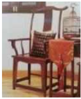
<그림 12> 새장, 자수쿠션

미관을 나타낸다. 특히 목재를 이용한 조각장식이 예술인데 주로 문, 창, 가구에 사용되고 이를 통해 공간을 풍요롭게 하는 조형의 변화를 의도한다. 식물, 화초를 위주로 하고 여의문(如意紋)을 등을 사용하였다. 중국 전통 가구 장식문양의 주요내용은 다음 <표 1>과 같다.