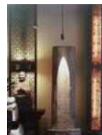
<그림 5> 불교영향 - 석상, 석등