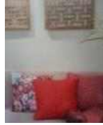
<그림 14> 창살 문양 장식, 黼 문양 쿠션