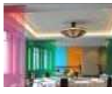
<그림 24> 평천장 페인팅 마감