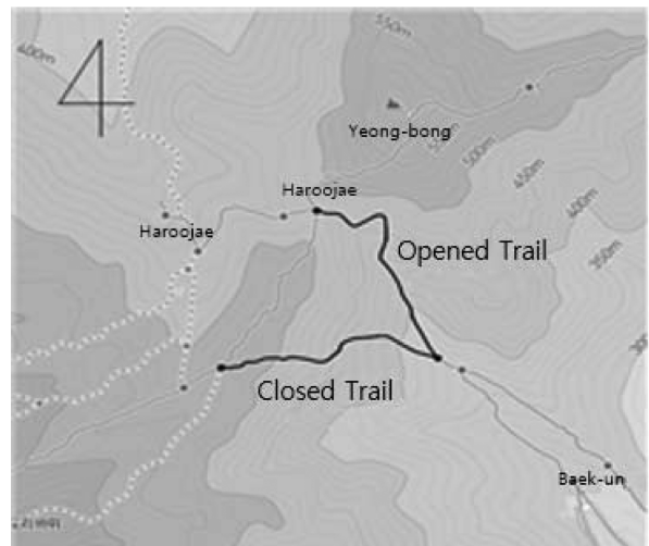
Figure 1. Location of trails in study area.

피도 조사에서 범용적으로 사용되고 있는 방법을 참고하였다(Cole, 1995; Nepal et al., 2007). 탐방로를 따라서 최소 10 m 이상의 간격으로 14개의 방형구를 설치하고, 탐방로 주변부에 조사구, 탐방로에서 4 m 떨어진 자연지역에 대조구를 설치하여 쌍을 이루었다(Figure 2). 조사는 2011년 10월 초에 예비답사를 실시하고, 10월 중순부터 11월 초 4일간 폐쇄 탐방로와 개방탐방로에 각각 14쌍의 조사구를 선정하여 식생피도를 조사하고 토양을 채취하였다.