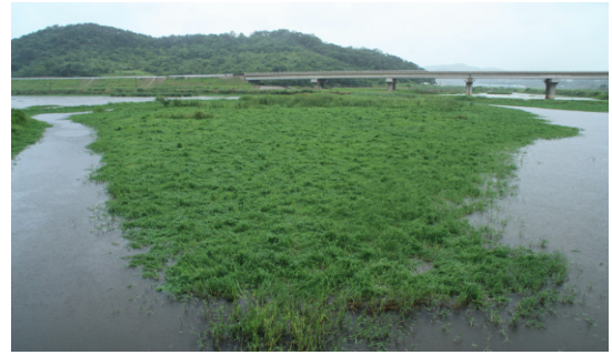
(b) Paspalum distichum var. indutum