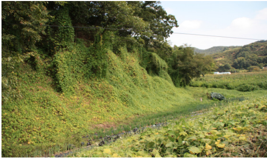
(a) Sicyos angulatus