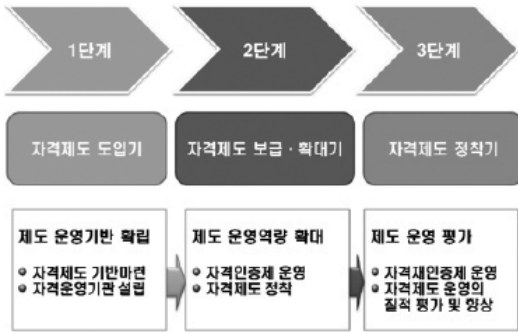
Figure 2. QI전문가 자격제도 도입의 단계적 접근 방법