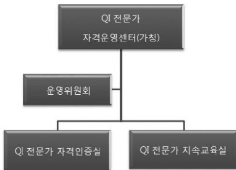
Figure 3. QI전문가 자격제도 운영기구(안)

QI전문가 자격인증실은 자격시험관리 업무와 자격시험 기준개발 업무 등을 수행한다. 자격검정은 자격을 부여하기 위해 필요한 직무수행능력을 평가하는 과정으로 QI전문가 자격인정은 민간기관에서 별도의 자격시험을 치루어 합격자에게 관련 자격증