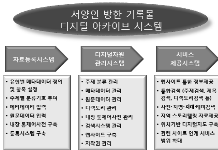
〈그림 1〉 개화기 방한 서양인 기록물 디지털 아카이브 시스템 구조도