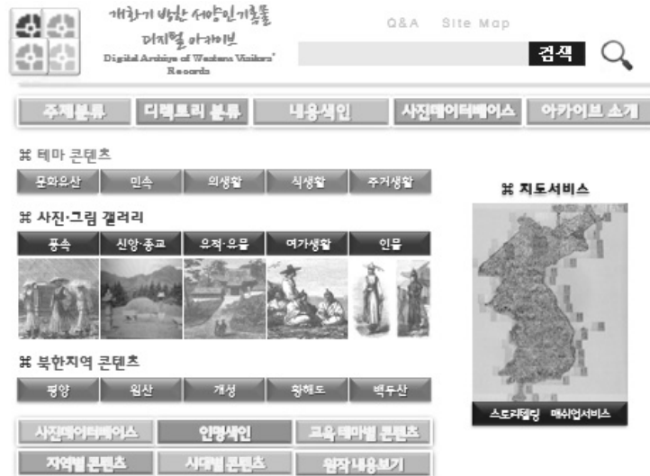
〈그림 2〉 개화기 방한 서양인 기록물의 디지털 아카이브 홈페이지 화면(안)

려, 조선, 대한제국, 일제강점기로 나누어지고, 지역분류는 경기도, 강원도, 충청도, 전라도, 경상도, 황해도, 평안도, 함경도의 8도로 구분하였다. 내용색인 메뉴는 원하는 항목을 가나다순으로 배열하여 이용자들이 쉽게 접근할 수 있게 한