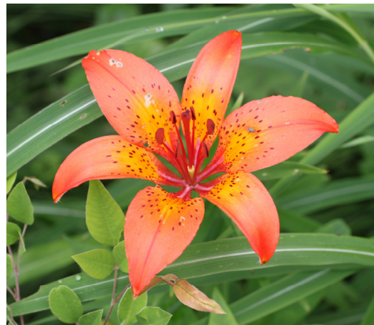
Fig. 2. A photograph of Lilium dauricum Ker Gawl.

부 천문대로 이어지는 남쪽사면에서 확인하였다. 복주머니란은 법화리에서 보현산 정상부로 이어지는 북쪽사면에서 1개체를 확인하였다. 날개하늘나리는 절골 쪽에서 시작되는 남쪽사면 정상부근 등산로 부근에서 1개체만을 확인되어 외부 교란에 쉽게 노출되어 있었다(Fig. 2). 날개하늘나리는 전국적으로 강원도 백암산과 대암산 등 강원도 이북 지방과 덕유산, 4개의 장소에서 분포가 확인되었으며, 최근 덕유산 개체군은 조사에서 발견되지 않아 사라진 것으로 추측되고 있다(Ministry of Environment, 2011). 개체수의 감소가 진행되는 시점에서 본 연구조사를 통해서 날개하늘나리의 분포지역을 새로이 추가된 것은 매우 중요한 의미가 있다. 하지만 이번 조사결과 날개하늘나리의 개체군은 확인되지 않고 단일개체만을 확인하였기 때문에 발견된 일대의 정밀한 조사가 요구되며 개체수 증가에 대한 방안이 필요하다. 또한 Park et al. (1999)도 복주머니란을 확인