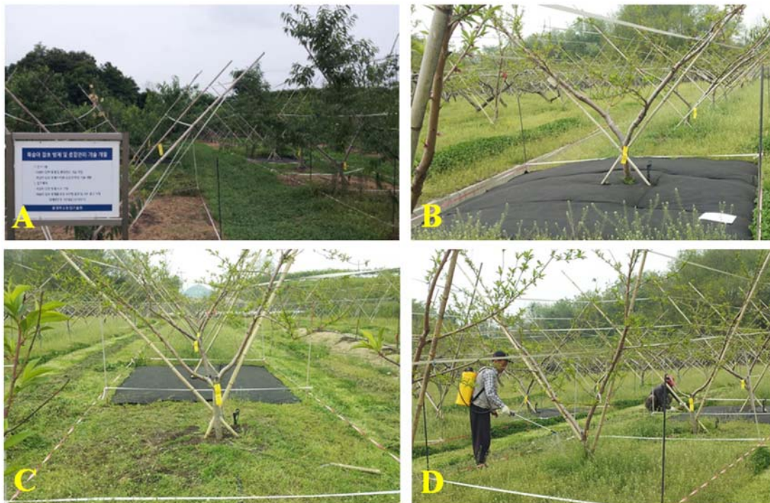
Fig. 1. Scene on each treatment plot for weed control at the peach orchard (2013~2014). A; experimental field, B; fabric-covering, C; machinery weeding, D; spraying of the herbicide (glufosinate ammonium).

복숭아 과원의 잡초방제 시험포장내에서 잡초 발생 조사는 2013년부터 2014년까지 시험구별로 구획을 나누었고 복숭아 생육이 본격적으로 이루어지는 5월 10일부터 8월 30일까지 우점종을 육안조사 하였다(Kyung Nong, 2013). 발생한 잡초는 Bayer code 형식으로 잡초의 이름을 약어로 표